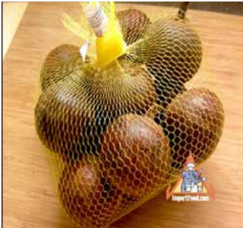
Gambar 1. Manggis dipasarkan di New York

manakala harga di New York ialah RM128–RM176 /kg.