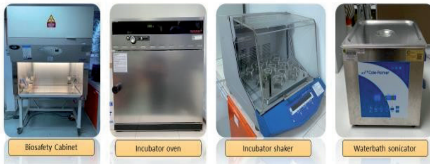
Rajah 24.4: Alatan penyediaan formulasi nano emulsi