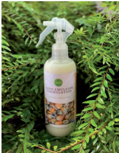
Rajah 24.2: Formulasi nano emulsi

pati dan lain-lain) dengan tindakan fungisida yang dimasukkan ke dalam nano-emulsi. Penggunaan nano-fungisida berasaskan nano-emulsi minyak pati dianggap sebagai alternatif terbaik untuk mengurangkan jejak persekitaran yang ditinggalkan oleh racun kulat sintetik sehingga meminimumkan kekerapan penggunaan semburan. Formulasi nano emulsi yang dihasilkan oleh MARDI berjaya mencegah penghasilan kulat tersebut sekali gus meningkatkan kualiti dan nilai pengeluaran jagung bijian. Pengiraan kepada kos pengeluaran penghasilan nano emulsi akan dijalankan bagi menilai visibiliti dan daya maju teknologi tersebut bagi pengeluaran secara komersial.