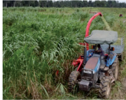
Pengujian mesin penuai Napier di Pusat Ternakan Haiwan (PTH) Ulu Lepar, Gambang