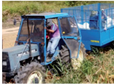
Pengujian treler di MARDI Kluang