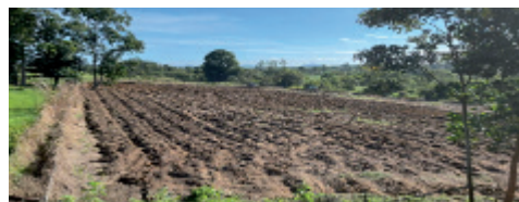
Ladang napier di MARDI Kluang