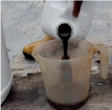
Sukatan molases secara manual

1. Gula molases dan Effective Microorganisms (EM) disukat terlebih dahulu secara manual sebelum dimasukkan ke dalam air bersih tanpa klorin