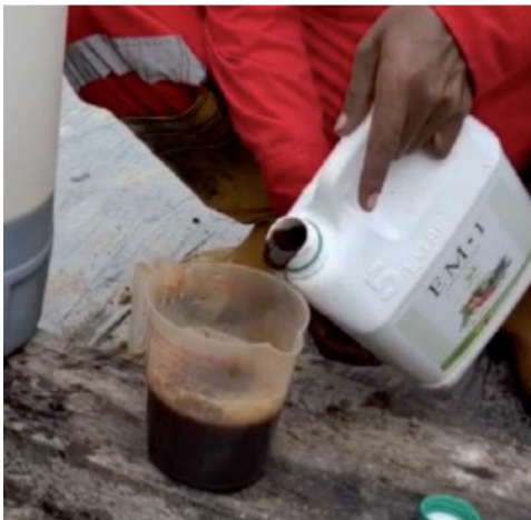
Sukatan EM secara manual