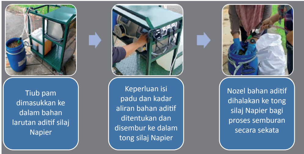
Rajah 4.2: Aplikasi mesin formulasi bahan aditif silaj Napier