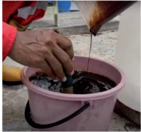
Molases dilarutkan ke dalam air