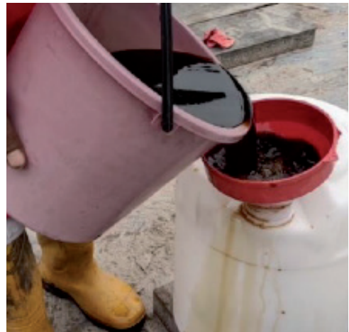
Campuran larutan molases dan EM disimpan ke dalam tong