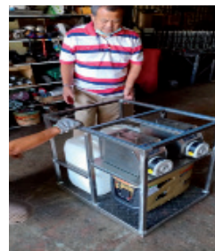
Pembangunan sistem penyemburan bahan aditif silaj napier