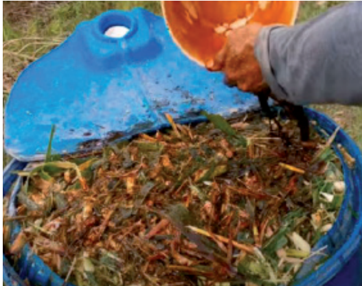
Proses siraman silaj Napier secara manual ke dalam tong

2. Kaedah manual pelaksanaan siraman campuran bahan aditif ke dalam tong silaj yang mana campuran bahan aditif dituang ke dalam tong silaj sebelum ditutup untuk proses pemeraman