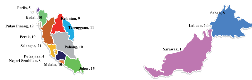
Rajah 12.2: Taburan kebun komuniti yang terlibat dalam kajian ini